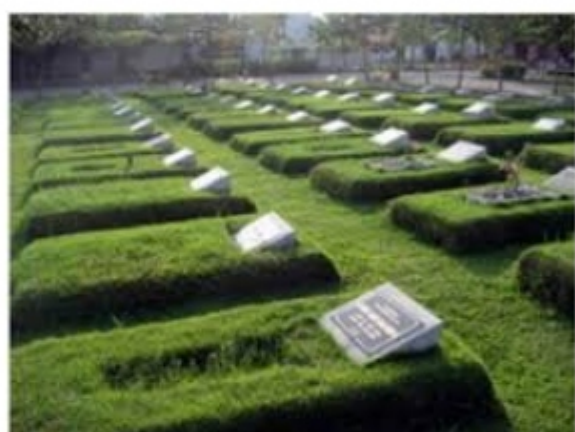
TEMPAT PEMAKAMAN UMUM