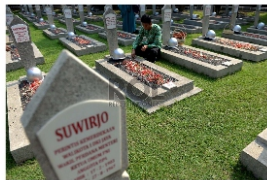
Taman Makam Pahlawan

Penetapan dan pengelolaan TPK sebagai tempat Pemakaman yang mempunyai nilai sejarah/kebudayaan atau mengandung nilai kepahlawanan