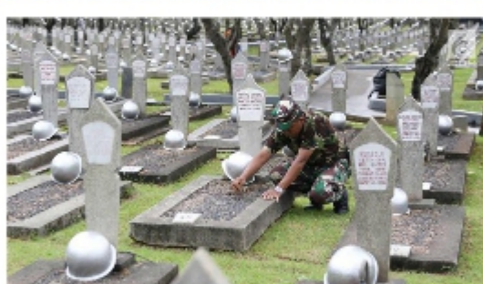
TEMPAT PEMAKAMAN KHUSUS