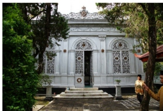
Astana Grlayu Makam raja2 Mangkunegaran