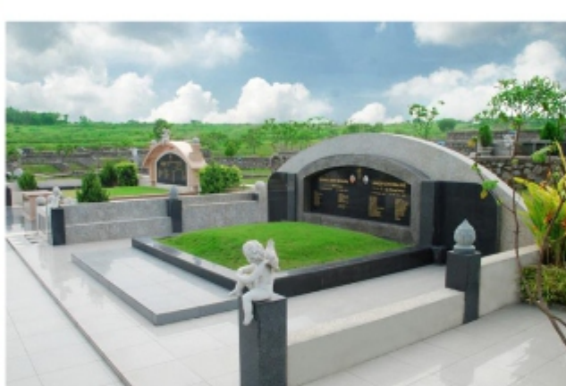
TEMPAT PEMAKAMAN BUKAN UMUM